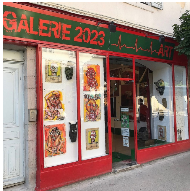
Vitrine de la galerie

La Galerie est constituée d'un espace 60 m 2 s'ouvrant largement sur la rue des salines à Lons le Saunier. Tous les murs de la galerie sont blancs et pourvus de cimaises équipés de fils perlons permettant l'accrochage des œuvres, la hauteur sous plafond est de 3,20 m. Le sol est revêtu d'un plancher couleur bois. L'ensemble est éclairé par des spots coulissants et orientables sur rails. Quelques socles en forme de cube destinés à la présentation de sculptures, modelages, objets 3D sont disponibles.